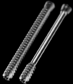
APTUS® SpeedTip® CCS