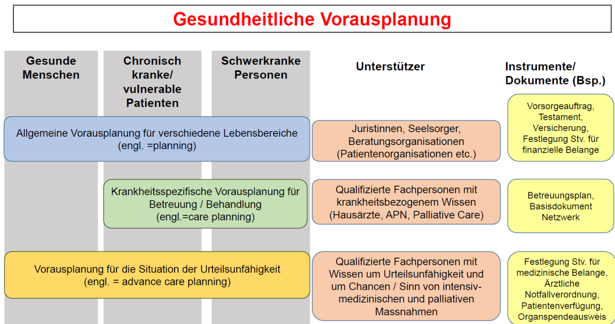
Abbildung: Ebenen der gesundheitlichen Vorausplanung

Eine regionale Koordination der verschiedenen Leistungserbringer im Behandlungsnetz ist zentral, damit die Vorausplanung entsprechend der Präferenzen der Betroffenen zum Tragen kommt. Zur Umsetzung ist die Darstellung der hierfür notwendigen Leistungen in den entsprechenden Vergütungssystemen unerlässlich.