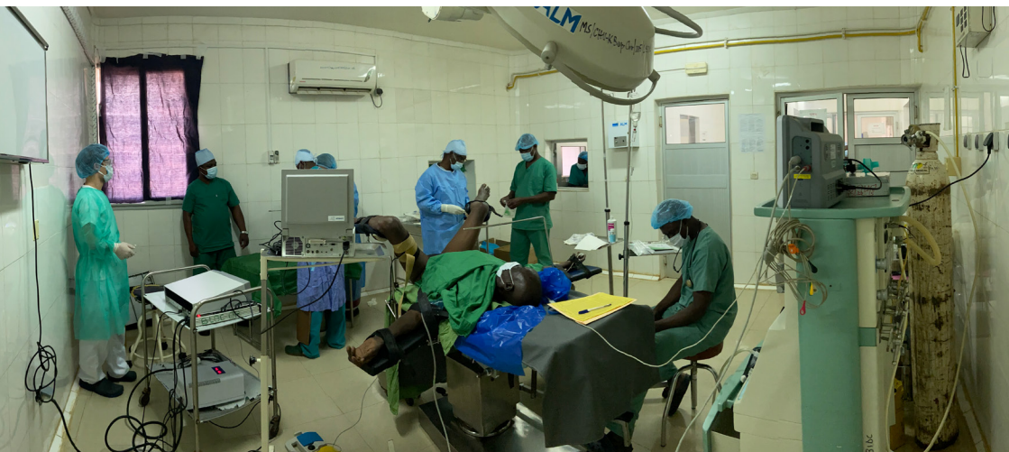
Abb.: Vorbereitungen zur ersten TUR-P am Universitätsspital in Kara, Togo.

Männer in fortgeschrittenem Alter können an einer gutartigen Vergrößerung der Prostata (benigne Prostatahyperplasie, kurz BPH) leiden, welche vom Prostatakrebs abzugrenzen ist. Das kann zu Problemen beim Wasserlassen bis zur Unfähigkeit, die Blase zu entleeren, führen. Bei BPH ist die transurethrale Prostataresektion (TUR-P) nun seit über 30 Jahren eine gängige Therapie, bei der Prostatagewebe durch die Harnröhre schonend entfernt wird.